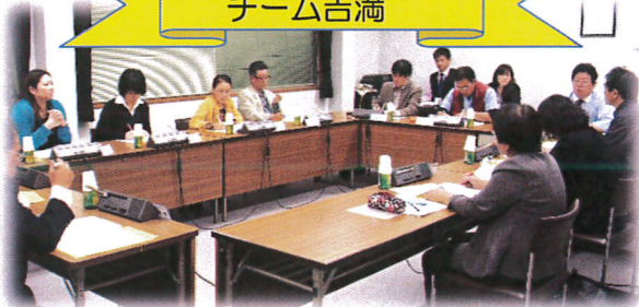
24時間連携体制構築 チーム吉満