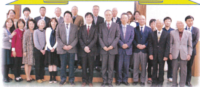
在宅医療推進連絡協議会